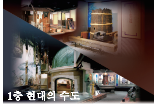
1층 현대의 수도