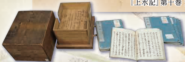
『上水記』東京都指定有形文化財(古文書)

江戸時代の水道の記録『上水記』年に一度の一般公開 10月31日(土) - 11月8日(日) 東京都水道歴史館 3Fレクチャーホール