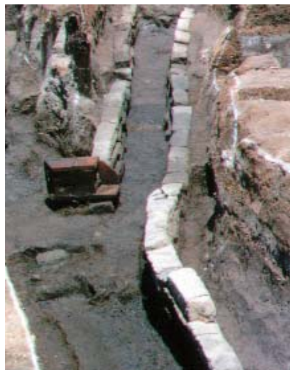
「溜池上水」？の石樋 (江戸城呉服橋門内・『東京都八重洲北口遺跡』より)