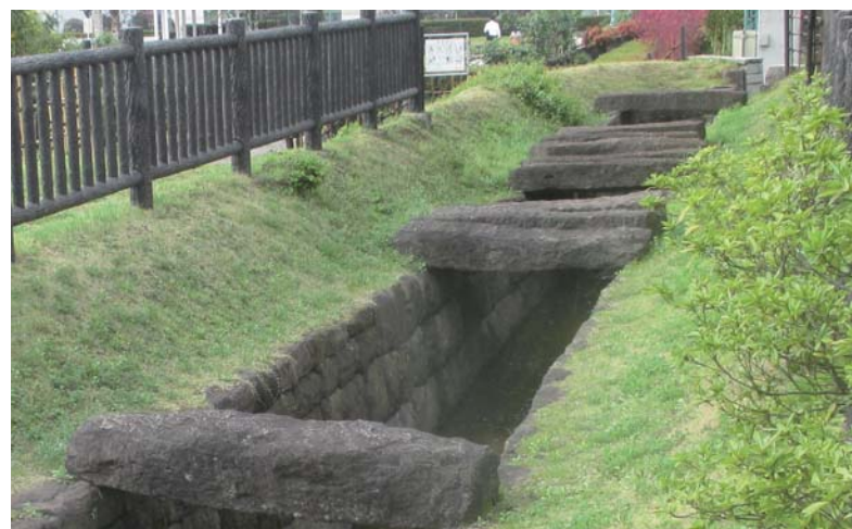
復原された神田上水石樋

画像資料に基づいてお話しする講座です。発掘調査により明らかにされた、神田上水関連の遺構や出土品をご紹介します。あわせて、現在たどることができる神田上水関連の史跡等をご紹介します。