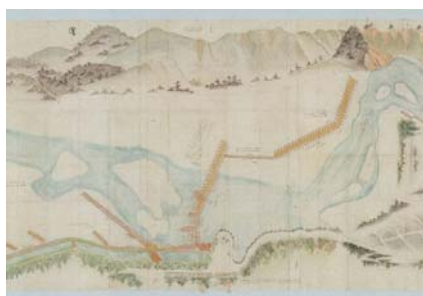
『上水記』 第2巻 部分