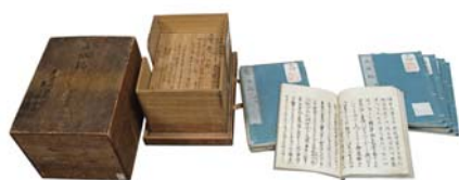
『上水記』 東京都指定有形文化財 (古文書)